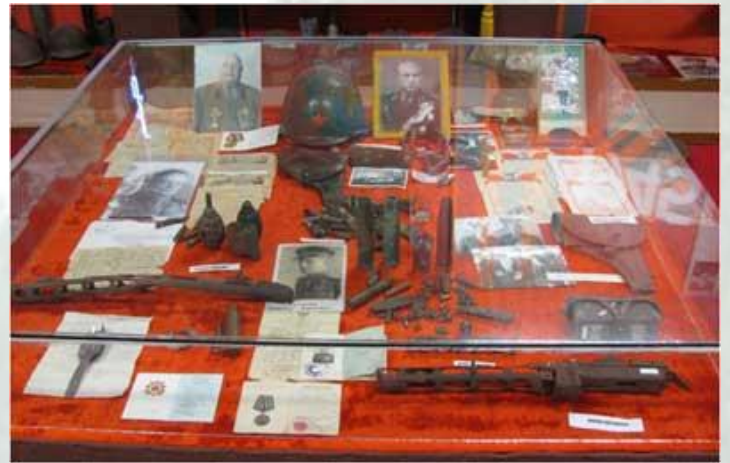
«Краснопольщина после войны»